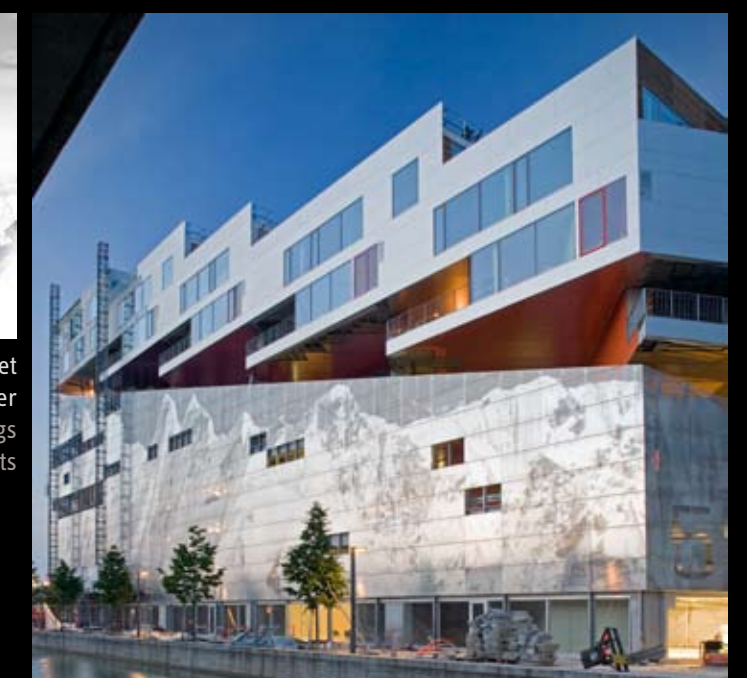
Bjerget BIG Arkitekter Mountain Dwellings BIG Architects