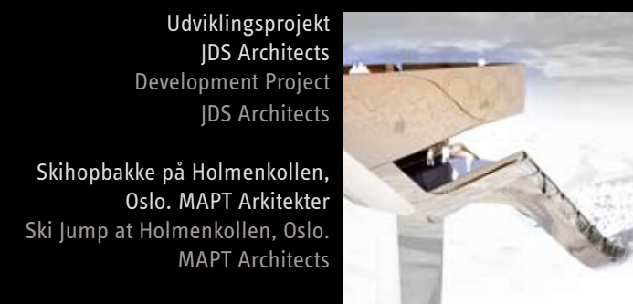
Udviklingsprojekt JDS Architects Development Project JDS Architects Skihoppbakke på Holmenkollen, Oslo. MAPT Arkitekter Ski Jump at Holmenkollen, Oslo. MAPT Architects

Resultatet af det gode samarbejde mellem M&B Design Team og arkitekter er flere præmierede byggerier. Senest har Bjerget vundet prisen som verdens bedste boligbyggeri ved World Architecture Festival 2008. The result of the good cooperation between M&B Design Team and architects are several prize-winning buildings. Recently, the Mountain Dwellings won the WAF08 prize for the best housing project in the world.