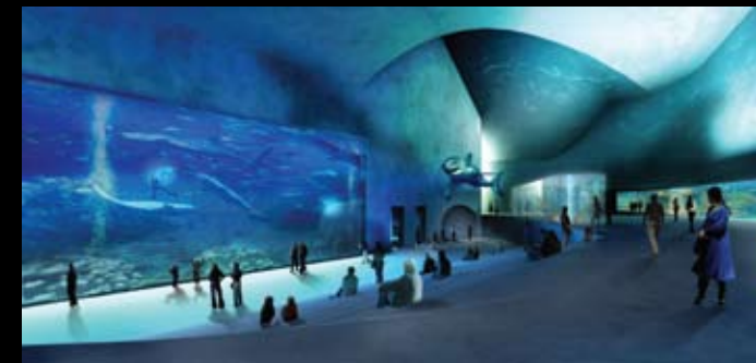
Den Blå Planet 3xN Arkitekter The Blue Planet 3xN Architects

Fremstilling af enkle, klare og letforståelige diagrammer ser vi ofte som en fordel til forklaring af komplicerede løsninger. Simple, clear, and easily understood diagrams are often used as an explanation of complex solutions.